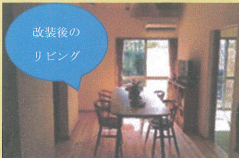
改装後の リビング

私たちみぎわは産経新聞さんに2回取り上げていただき、またフェイスブックなどを通してより多くの方「ホームホスピス」の動きを紹介させていただいております。良ければそちらもご覧になっていただければと思います。